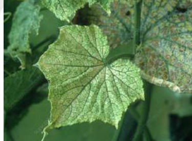
الكاروس في الخيار