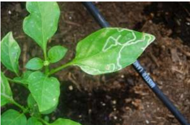
صانعات الانفاق في الفلفل