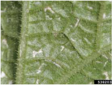
التربس في الخيار