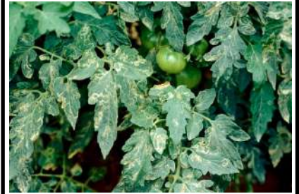
صانعات الانفاق في الطماطم