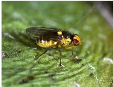
الحشرة الكاملة لصانعات الانفاق