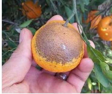
اكاروس صدا الحمضيات