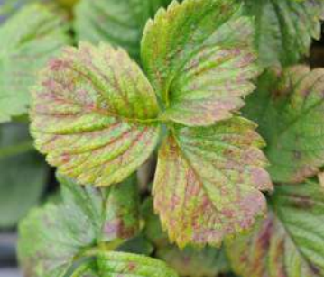
الاكاروس في الفراولة