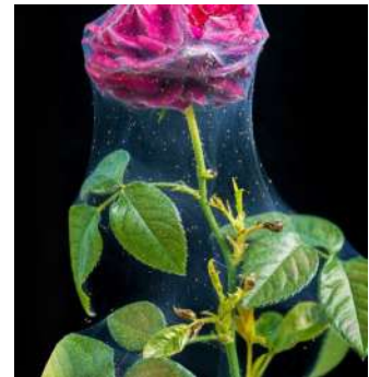
الكاروس في نباتات الزينة