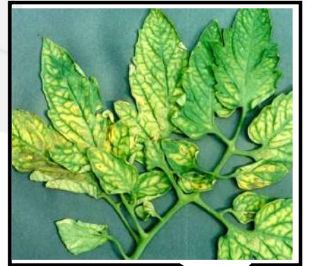
نقص الماغنسيوم في الطماطم