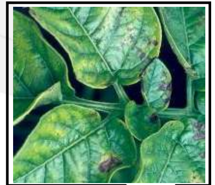
نقص الماغنسيوم في البطاطس