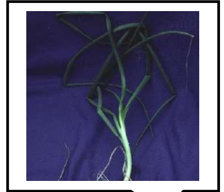
نقص الماغنسيوم في البصل