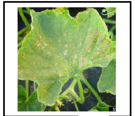
نقص الماغنسيوم في الخيار