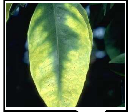
نقص الماغنسيوم في الموالح